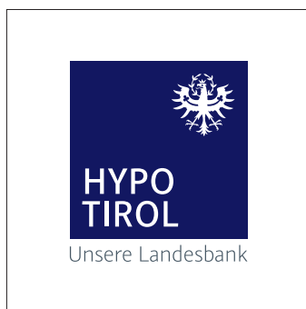
Logo-Standard-Variante mit grauem Claim auf weißem Hintergrund.