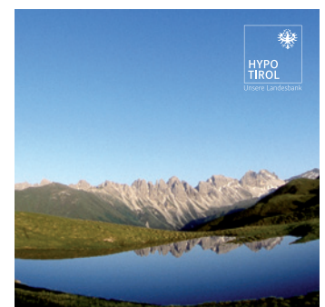
Bei passenden (Bild-)Hintergründen kann alternativ auch eine passende Outlined-Variante zum Einsatz kommen.