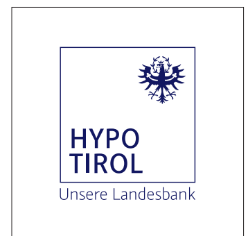
Alternative Logo-Outlined-Variante in dunkelblau oder schwarz auf hellen Hintergründen/Bildern.