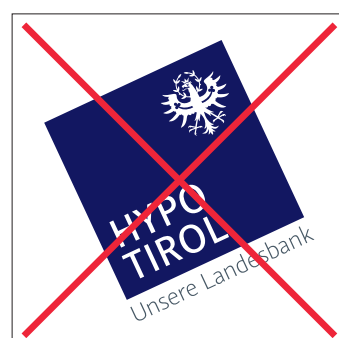
Logo nicht drehen und keine Verwendung von Effekten!