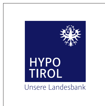
Logo-Standard-Variante mit dunkelblauem Claim auf weißem Hintergrund.