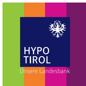
Logo-Standard-Variante mit weißem Claim auf farbigem Hintergrund.