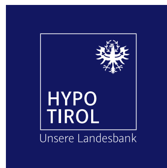
Alternative Logo-Outlined-Variante mit weißem Claim auf farbigem Hintergrund.