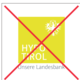
Logo-Farben nicht verändern!