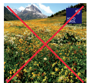
Unruhige (Bild-)Hintergründe vermeiden.