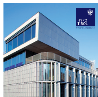
Auf (Bild-)Hintergründen eine Standard-Logo-Variante mit kontrastreichem Claim auswählen und wenn möglich auf ruhiger Stelle platzieren.