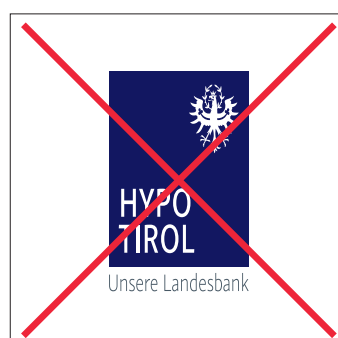
Logo in keine Richtung verzerren bzw. manipulieren!