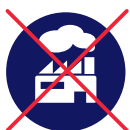
Stromerzeugung mit Kohle

Unsere Expertinnen und Experten gewährleisten, dass ihr Kapital in Länder, Branchen und Unternehmen investiert ist, für die nachfolgende Total- bzw. Teilausschlusskriterien gelten: